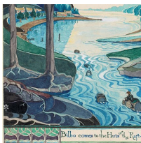
La più grande mostra mai dedicata a J.R.R. Tolkien