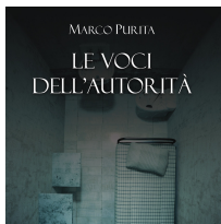
LE VOCI DELL'AUTORITÀ – Marco Purita – 96 rue de- La-Fontaine Edizioni