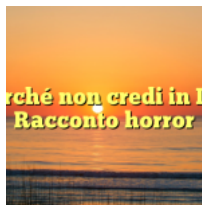
Perché non credi in Dio. Racconto horror